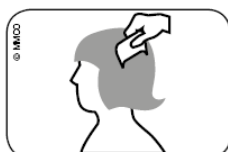
Fig. Pasar la lendreras por el cabello mojado, desde el cuero cabelludo hasta las puntas.