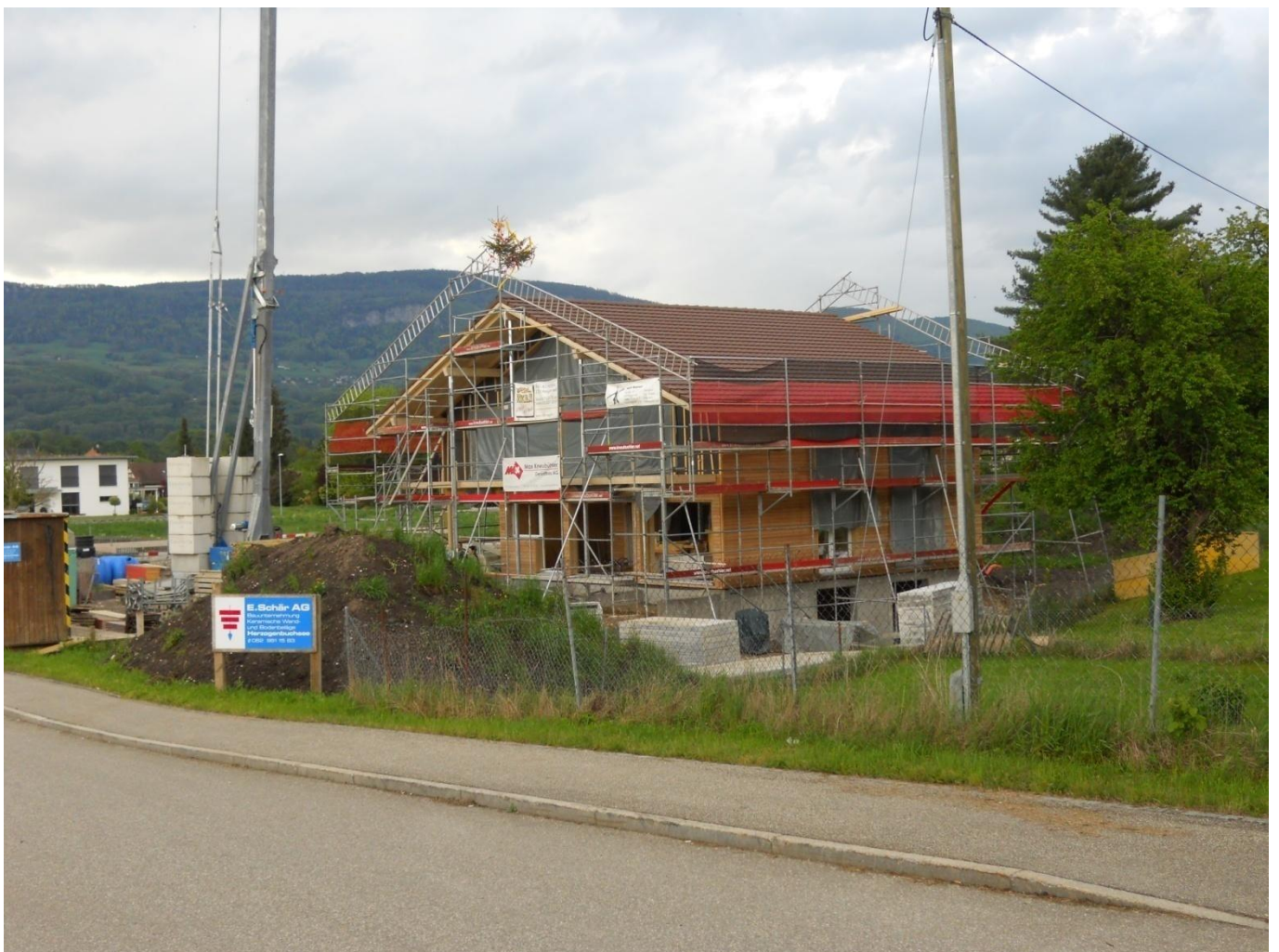
Bauboom in Wangen an der Aare