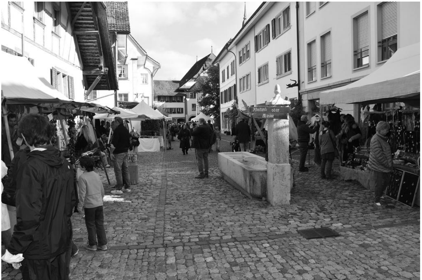
Mittelaltermarkt im Städtli