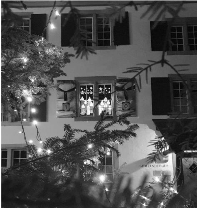
unser letztjähriges Adventsfenster

Der Gemeinnützige Frauenverein setzt die schöne Tradition der Adventsfenster fort, so dass auch in diesem Jahr an jedem Abend im Advent ein Fenster "geöffnet" wird.